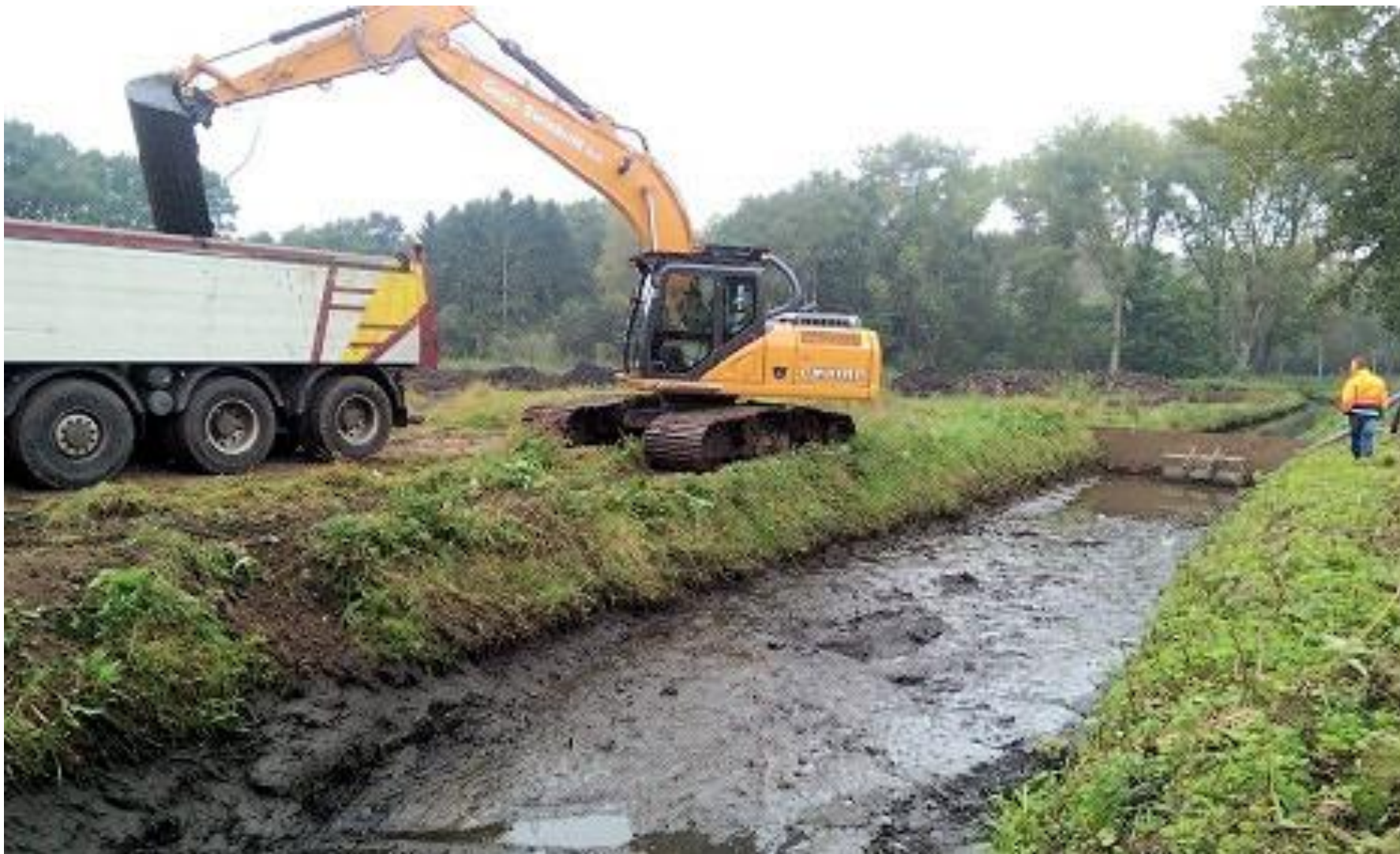
Figuur 38 Het vervuilde slib wordt door de gemeente Helmond in dit geval, afgevoerd. De gemeente kan op haar beurt de kosten middels een schadevergoeding verhalen, mits er sprake is van een onrechtmatige daad.